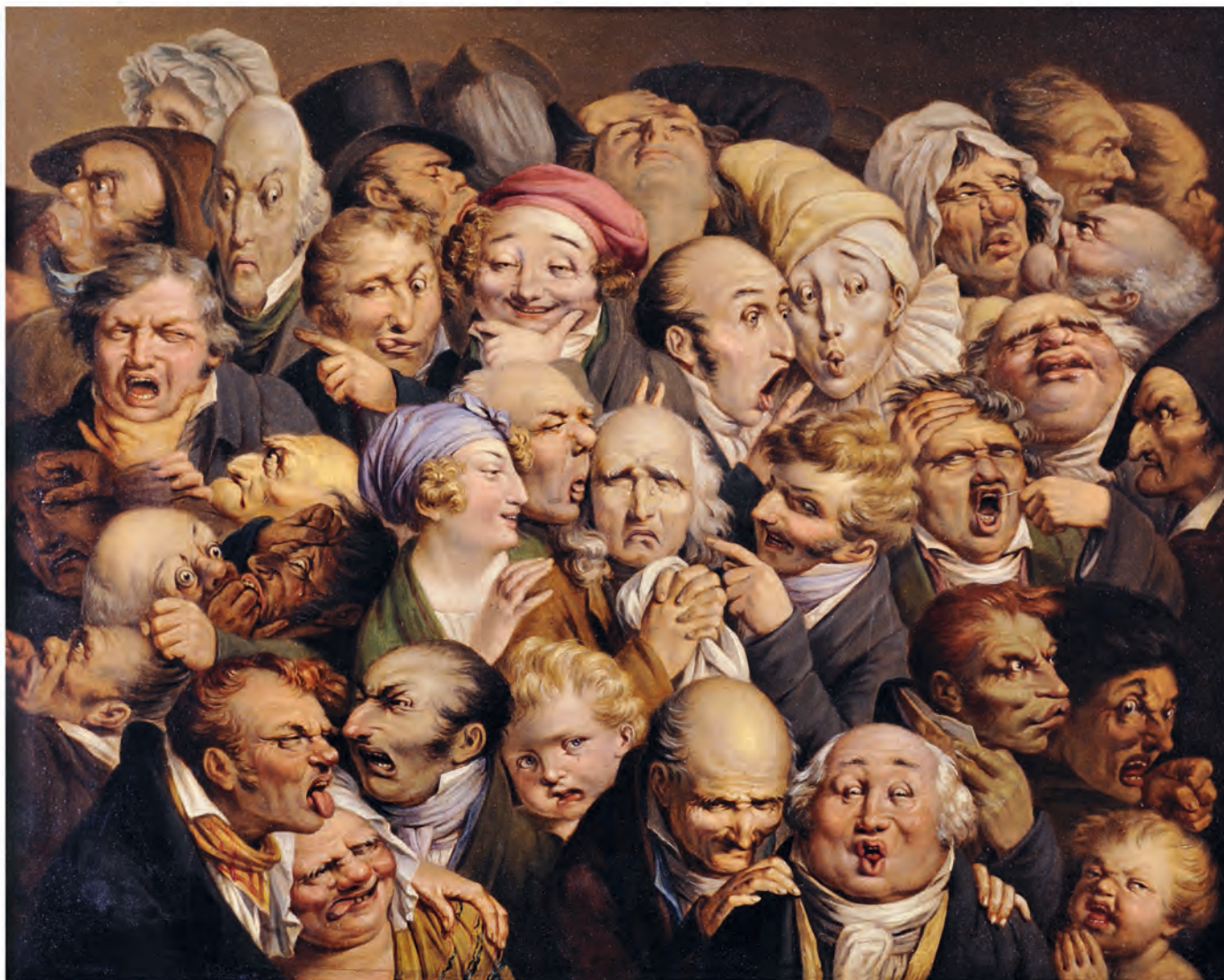
Louis-Léopold Boilly (1761-1845). Reunión de treinta y cinco cabezas con expresión , ca. 1823-1828